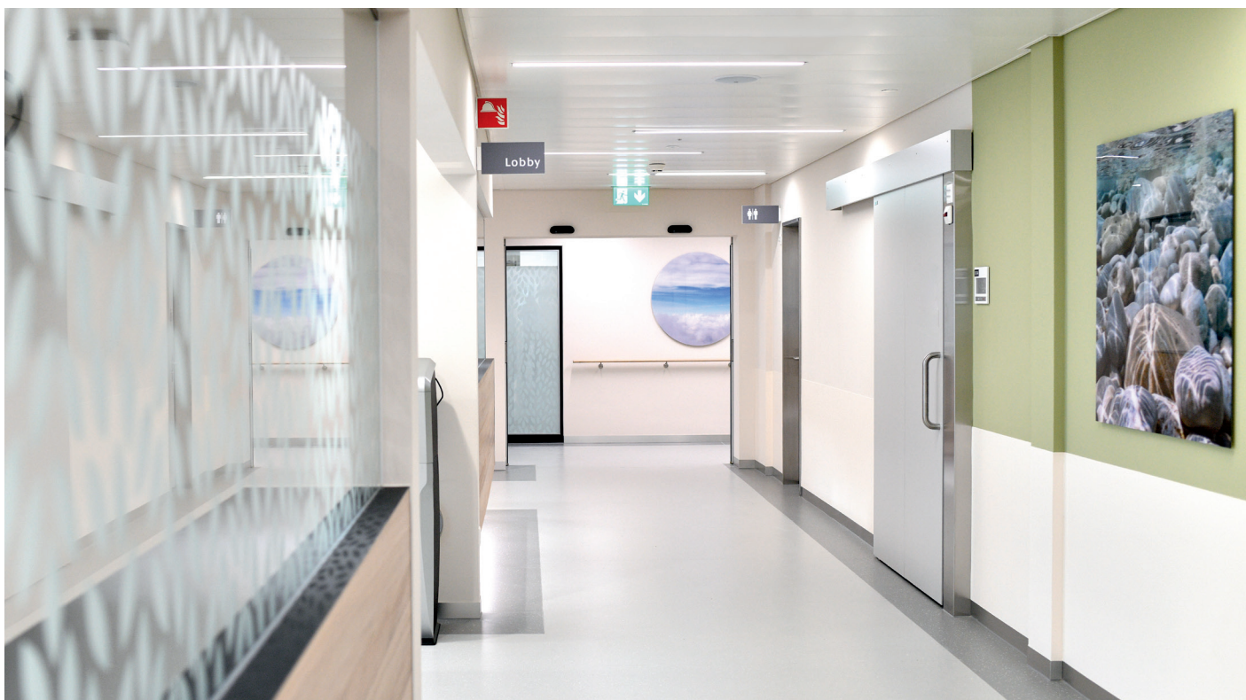
Die gute Atmosphäre im Claraspital wird durch die ansprechende Gestaltung der Räumlichkeiten unterstützt. Hier der Empfangsbereich der neuen Kardiologie.

Nach nur sieben Jahren Bauzeit hat das Claraspital 2022 die vorletzte Etappe seiner Infrastrukturerneuerung abgeschlossen. Letzter Teil dieses Gesamtprojekts war der «Umbau Süd», der im Februar vollendet wurde. Das Finale mit der Bereinigung des Aussenraums und dem Bau einer neuen Notfallzufahrt ist bis Oktober 2022 vorgesehen.